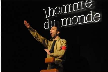
Le nazi et le barbier (2013)