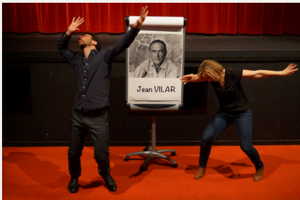
Qu'est-ce que le théâtre ? (2021)