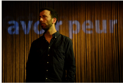
D'autres vies que la mienne (2015)