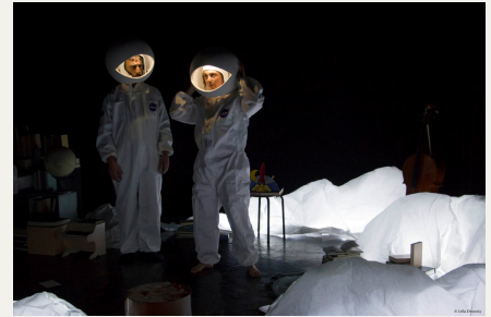
L'écorce des rêves (2017)